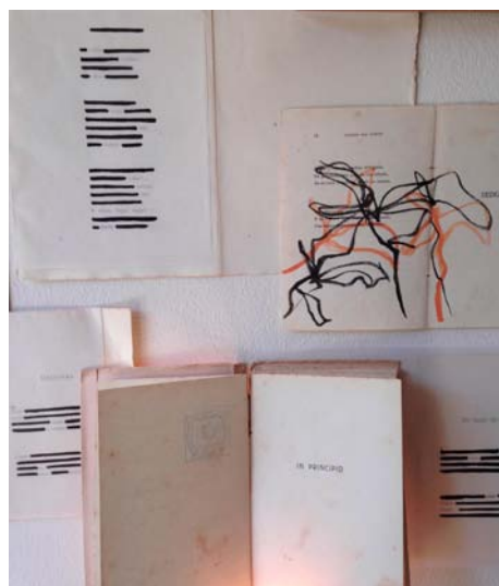
Fig. 2a e 2b. Diário em deslocamento (detalhes).

Como pensar o texto que nasce assim, se escreve a partir de objetos, fragmentos, imagens visuais e literárias, sem seguir uma ordem linear ou contar uma história inteira nem única? Para descrever esse escrever além da narratividade, vamos buscar o termo textualidade, da obra de Maria Gabriela Llansol: