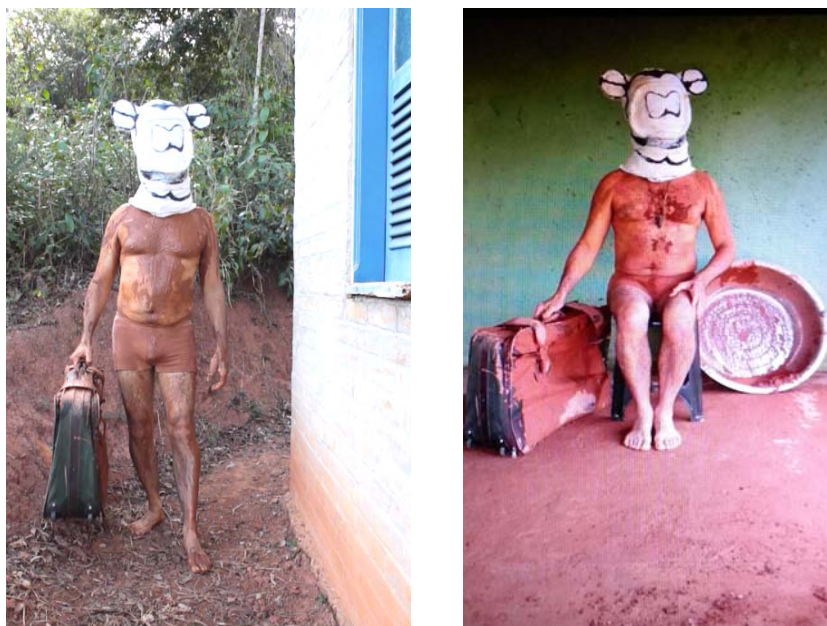
Fig. 3: De Jurupixunas a Paracatu de Baixo, por Jorge Cabrera. Fotogramas. Audiovisual. 5'50".