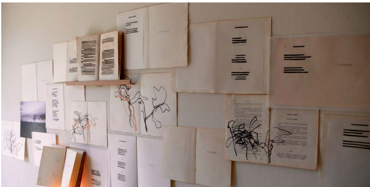
Fig. 1. Diário em deslocamento, composição em forma de painel vertical, de Lia Krucken. Obra apresentada na Bienal Internacional de Arte Contemporânea de Cerveira, Portugal, 2018.