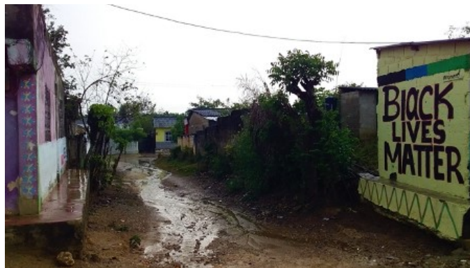
San Basilio de Palenque (Kolumbien) – Symbol für den Widerstand und Freiheitskampf afrikanischer Versklavter in Lateinamerika