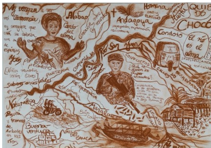
Aufzeichnung einer Forschungsreise durch die kolumbianische Pazifikregion, Februar 2019