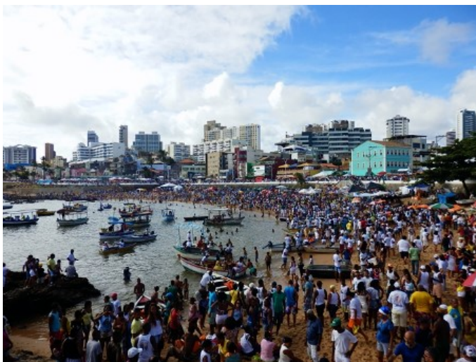
Fest zu Ehren der Meeresgöttin Yemanjá in Salvador da Bahia (Brasilien)